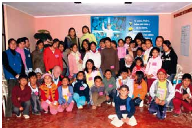
I bambini dei Banquitos con la delegazione trentina del Canale

Gli interventi realizzati fino a oggi sono serviti sia per dare una risposta alle situazioni di emergenza in cui queste persone vivono, sia a offrire l'educazione necessaria a garantire loro un futuro. In particolare, il contributo di Cooperfidi verrà utilizzato per finanziare parte dei lavori di ristrutturazione della sede di Redes, dove si svolgono le attività proposte, che costeranno complessivamente a 125 mila euro.